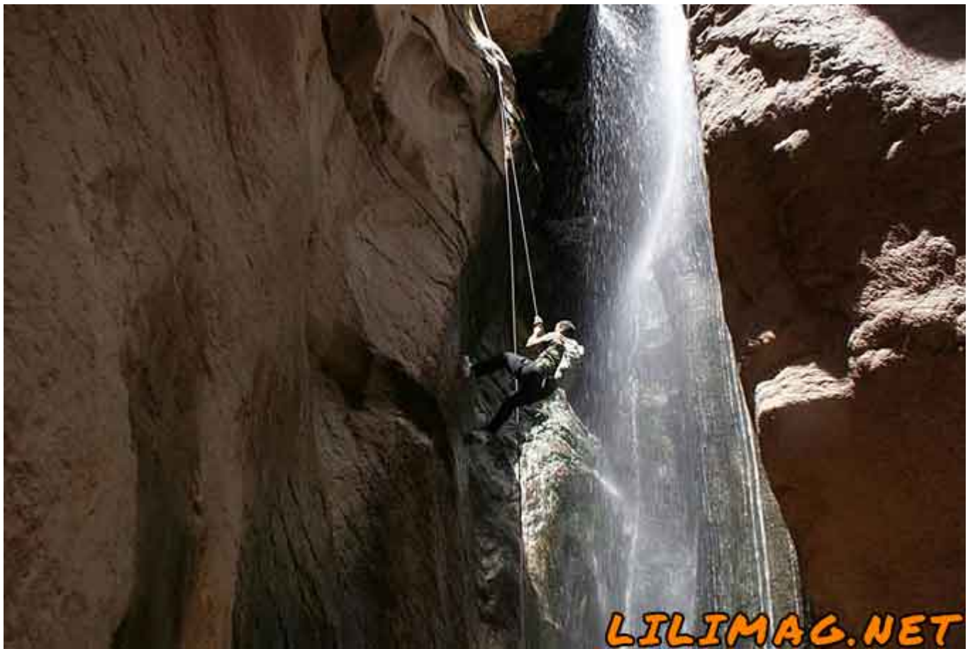
آبشارهای دیدنی سیمک از جاذبه های طبیعی کرمان