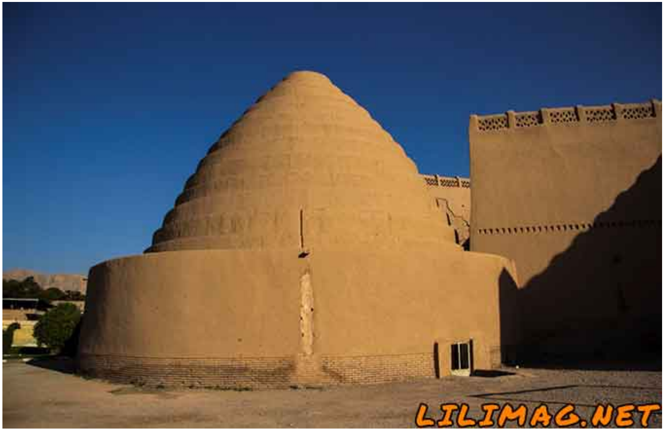
جاهای دیدنی کرمان - یخدان مویدی، بزرگترین یخچال خشت و گلی جهان