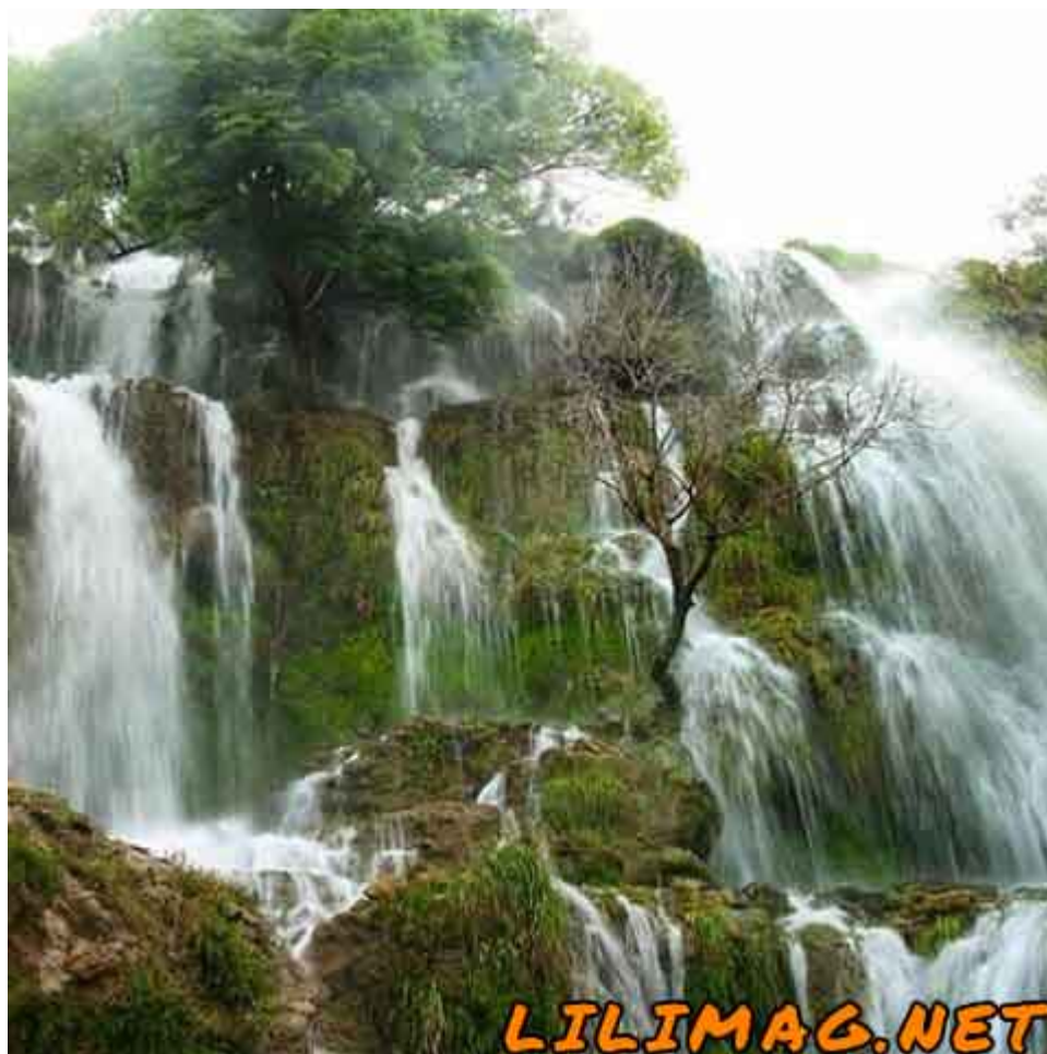
جاهای دیدنی کرمان - آبشار خوشکار در بافت کرمان