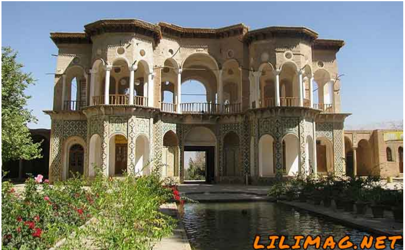
باغ شازده ماهان - معرفی بهترین جاذبه های گردشگری کرمان