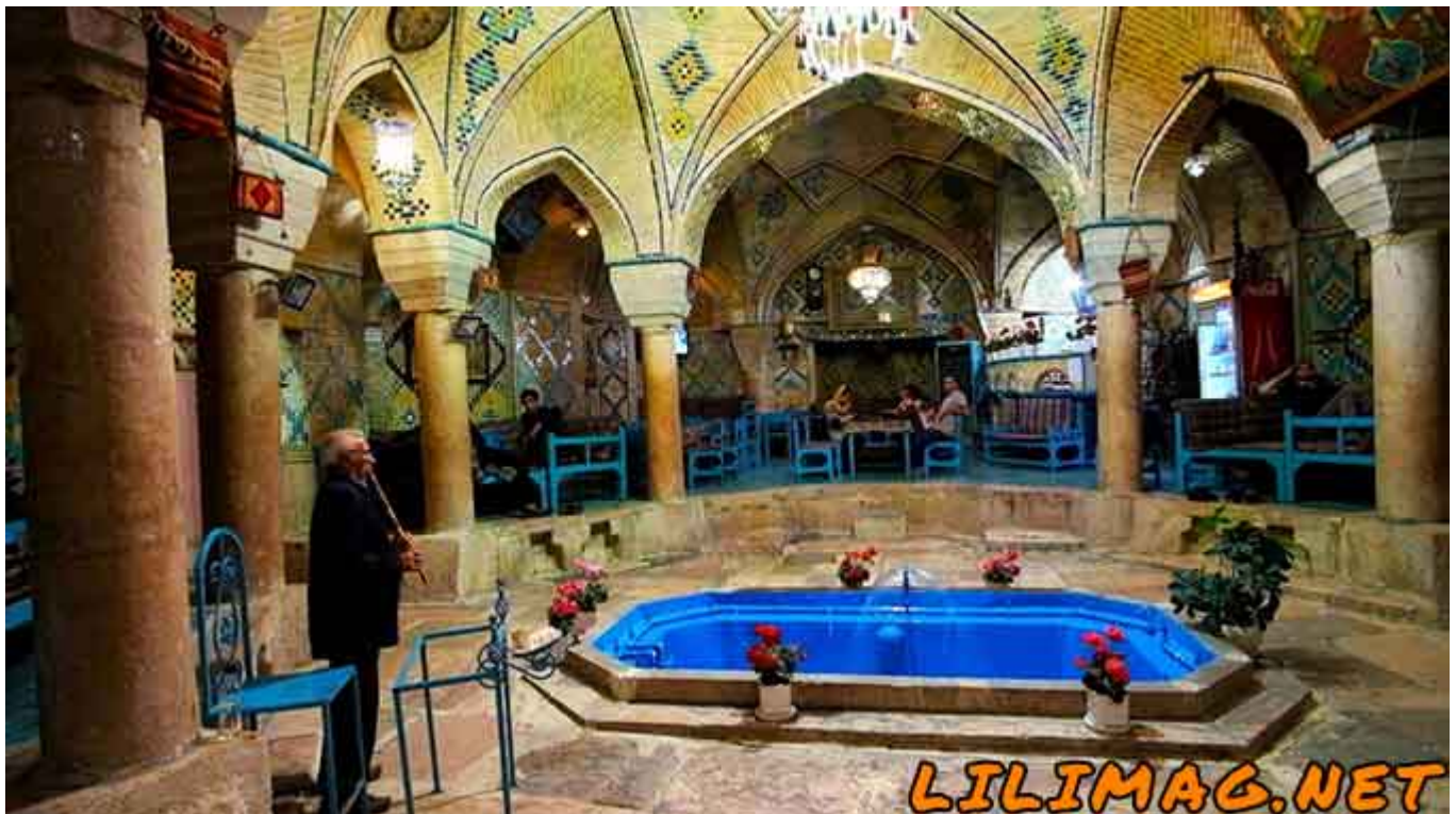
جاهای دیدنی کرمان - سفره خانه سنتی و چایخانه در حمام وکیل کرمان