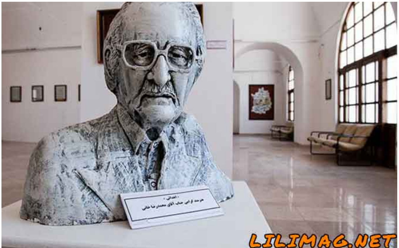
موزه هنرهای معاصر کرمان - معرفی بهترین دیدنی های کرمان