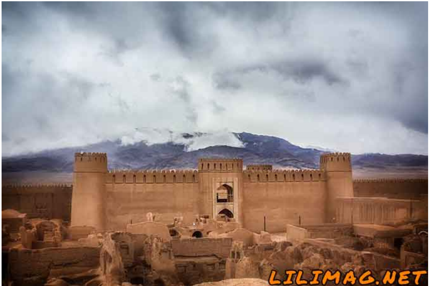
جاهای دیدنی کرمان - قلعه راین کرمان دومین بنای خشتی عظیم در دنیا