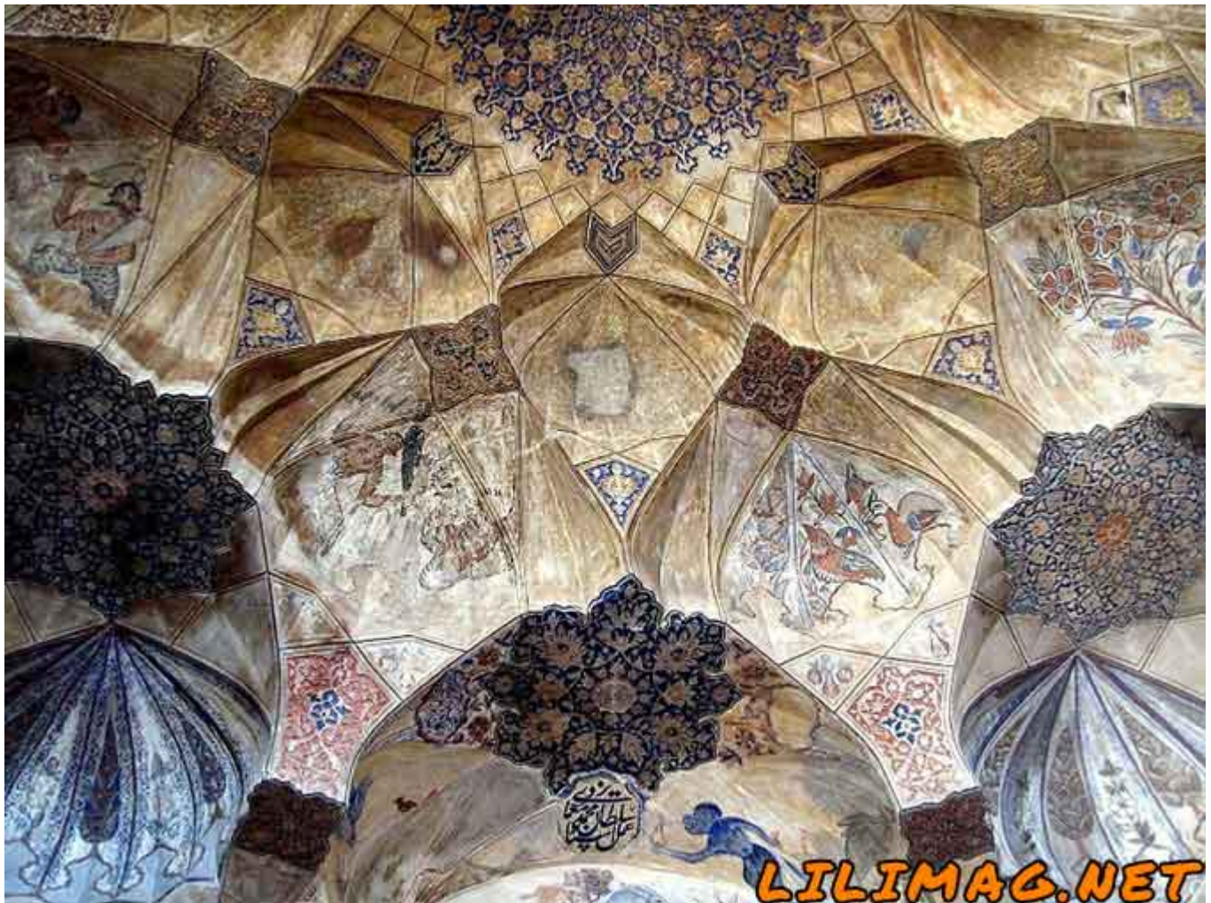
جاهای دیدنی کرمان - معماری بی‌نظیر مجموعه گنجعلی خان کرمان

بازار گنجعلی خان در ضلع شمالی میدان گنجعلی خان و در حدفاصل چهارسوق و بازار اختیاری قرار گرفته است. این بازار به دلیل داشتن معماری دیدنی و جذاب، گردشگران زیادی را به خود جذب می‌کند. مدرسه گنجعلی خان نیز دیگر بنای دیدنی مجموعه محسوب می‌شود که در ضلع شرقی میدان گنجعلی خان قرار گرفته است. در کتیبه‌ی سر در این بنا تاریخ 1007 هجری قمری (معادل با 1598 میلادی) درج شده است که نشان می‌دهد این اثر مربوط به دوران صفویه است. این مدرسه در طول تاریخ به کاروانسرا تبدیل شده است.