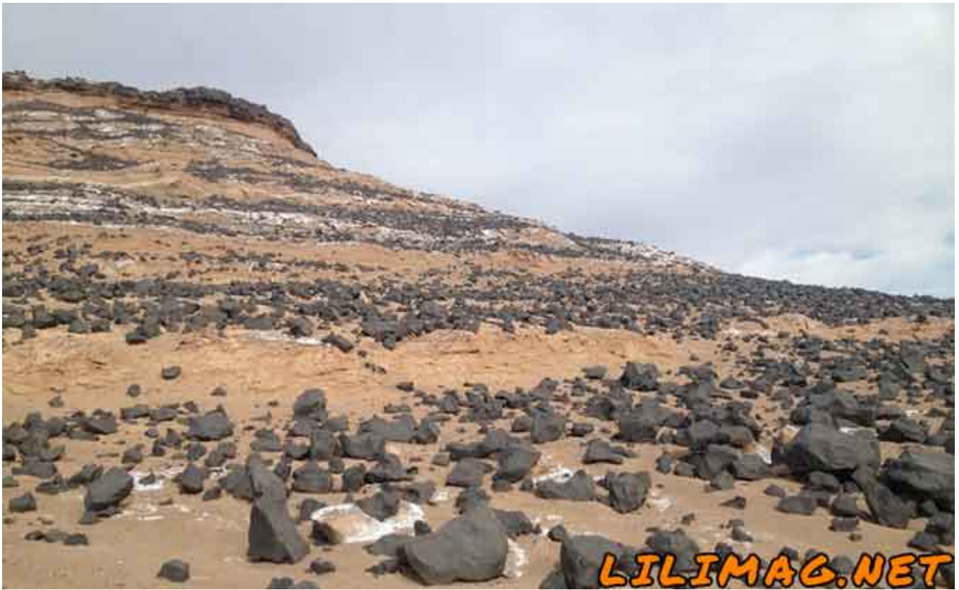
جاهای دیدنی کرمان - منطقه گندم بریان کرمان، گرمترین نقطه زمین با پوششی از گدازه‌های سیاه‌رنگ