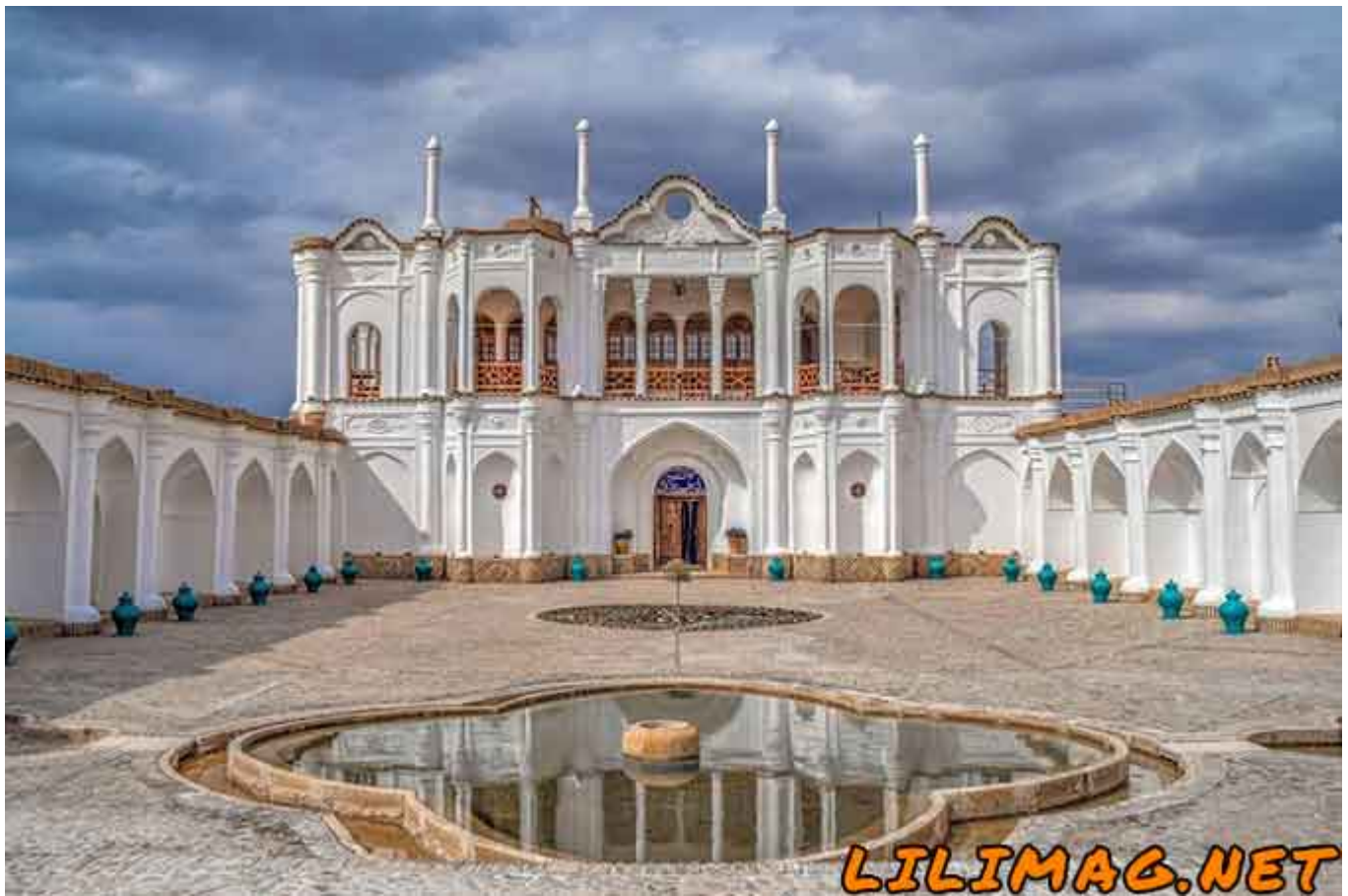
باغ فتح‌آباد - معرفی بهترین جاذبه های گردشگری کرمان