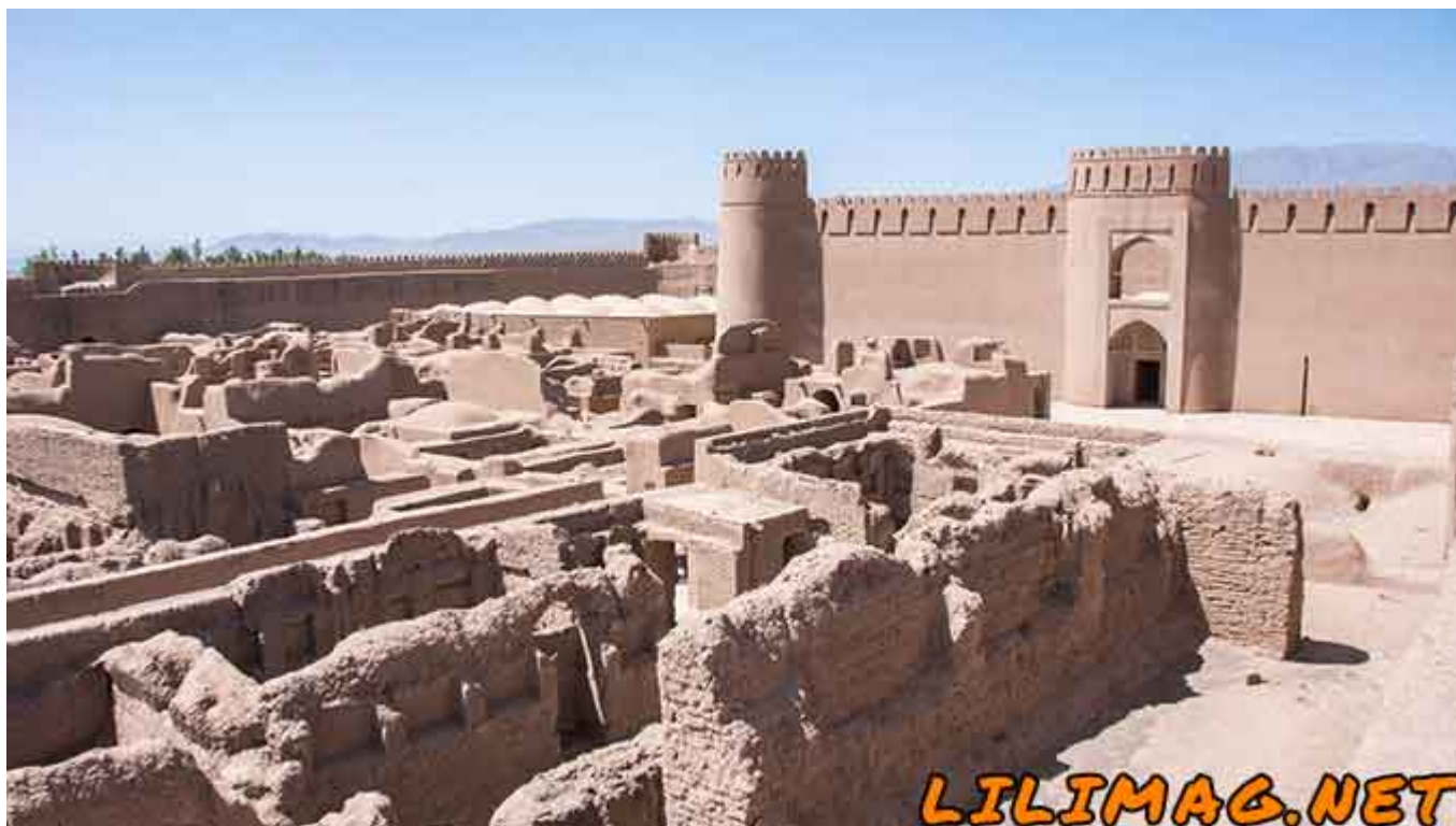
معرفی بهترین جاذبه های گردشگری کرمان

بنابراین استان کرمان انتخابی مناسب برای گردشگران داخلی و توریست‌های خارجی است. اگر قصد مسافرت به استان کرمان را دارید، حتما این مقاله از مجله اینترنتی لی‌لی‌مگ را مطالعه بفرمایید تا با بهترین دیدنی‌های کرمان آشنا شوید.