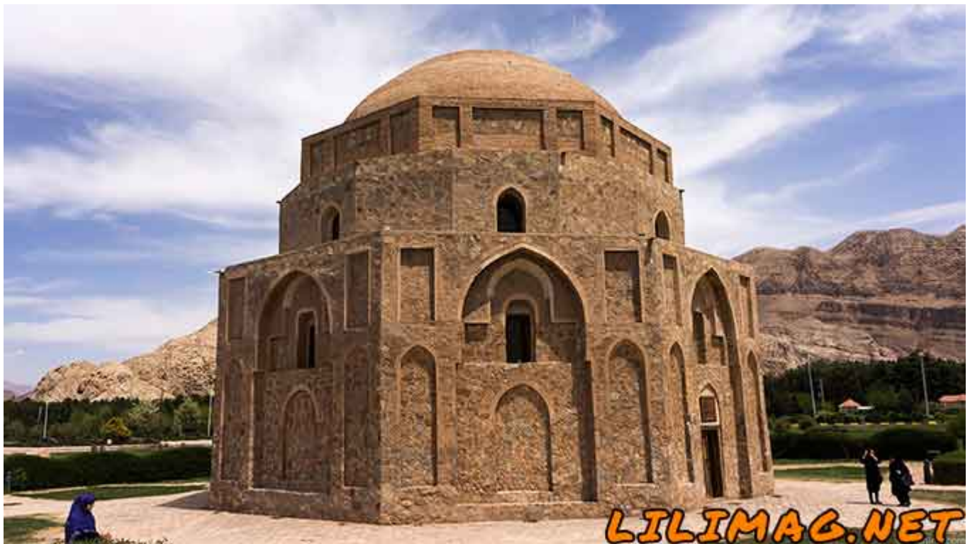
جاهای دیدنی کرمان - معرفی بهترین جاذبه های گردشگری کرمان