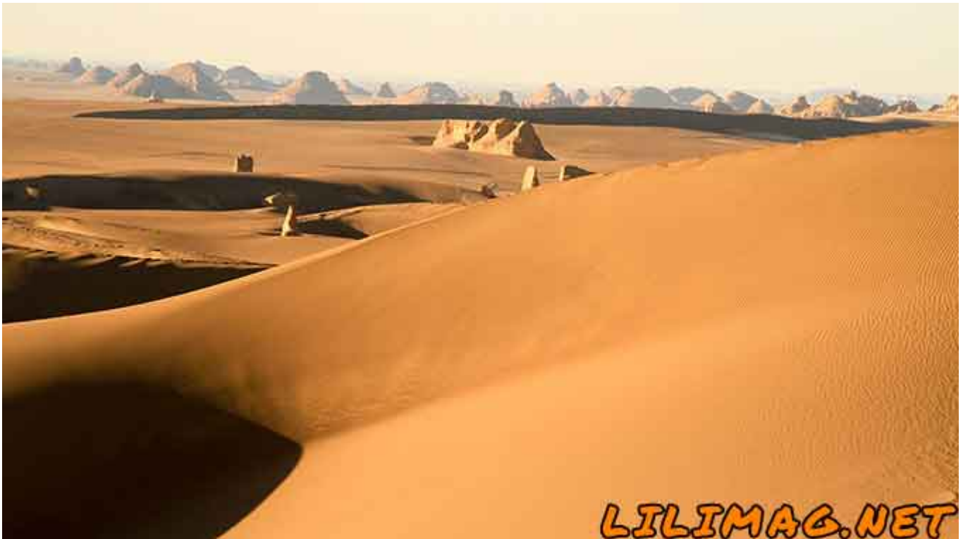
جاهای دیدنی کرمان - کویر زیبای لوت با جاذبه های شگفت‌انگیز از نقاط دیدنی در سفر به کرمان

برای آشنایی بیشتر با شهر زیبای کرمان و جاذبه‌های گردشگری آن، ویدئوی زیر را مشاهده نمایید